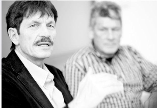
«Eine lebendige Gesellschaft achtet darauf, dass es möglichst allen Menschen gut geht.» Mäders neueste Untersuchung «Wie Reiche denken und lenken» (2010) hat in der Öffentlichkeit hohe Aufmerksamkeit erlangt.

Ich habe das Gefühl, dass sich bei den sozial Benachteiligten etwas verändert. Früher dachten diese, sie seien selber Schuld an ihrer Situation, heute sind sie empörter und wütender über die sozialen Ungleichgewichte. Im Idealfall setzen sie sich stärker für die eigenen Inte-